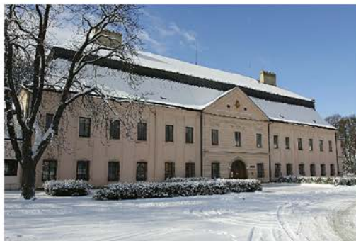
Zámek Kinských, Valašské Meziříčí