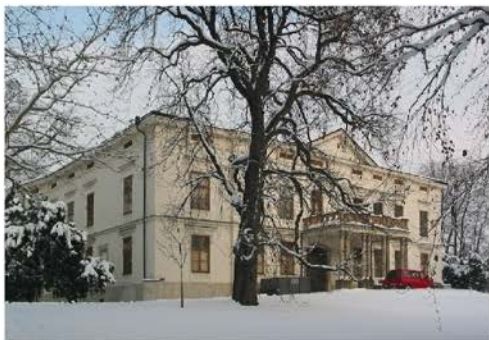
Zámek Lešná u Valašského Meziříčí